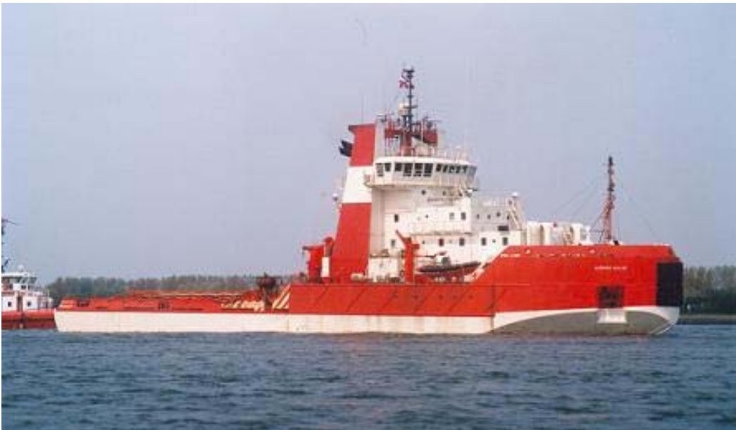
SMIT SIBU als CANMAR IKALUK

SMIT SIBU 8130693, 15-11-1982 te water gelaten, 4-1983 opgeleverd door Nippon Kokan K.K., Tsurumi (1007) als IKALUK aan BeauDril Ltd., Vancouver-Canada, in beheer bij Gulf Canada Ltd., Toronto, 3.327 BRT, 14.804 EPK, 10.885 kW., Wärtsilä 8R32, 1989 ingebracht bij BeauDril (1987) Ltd. Partnership, Vancouver-Canada, in beheer bij Gulf Canada Ltd., Toronto, 1993 verkocht aan Amoco Canada Petroleum Co. Ltd., Vancouver-Canada, in beheer bij Canada Marine Drilling Ltd., 1995 herdoopt CANMAR IKALUK, 2-1998 verkocht aan Smit International Singapore B.V., Nassau-Bahamas, 11-2-1998 vertrokken van St. John's, Canada, 1998 herdoopt IKALU, 11-2-1998 in charter bij Smit Americas Inc., Houston, Texas, 7-1998 einde charter, 12-1998 als IKALU vertrokken van Rotterdam naar Rusland, 1999 herdoopt SMIT SIBU, 2000 verkocht aan Smit Singapore (Pte.) Ltd., Nassau-Bahamas, 2000 thuishaven: Kholmsk, vlag: Rusland, 4-1-2006 (e) in beheer bij Femco-Management Ltd., Yuzhno-Sakhalinsk, Rusland voor Sakhalin Energy Investment Corp., na afgelost te zijn door de SMIT SAKHALIN vertrokken naar Keppel Tuas Shipyard, Singapore om verbouwd te worden tot stand-by reddingsvaartuig.