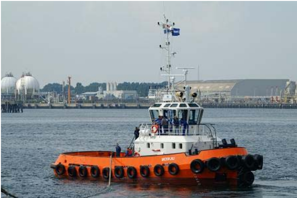
MOSKAU trekproeven in de Europoort

MAGNUS 9344966, 4-8-2006 te Cuxhaven gedoopt MAGNUS en opgeleverd door de Muetzelfeldtwerf te Cuxhaven aan Harms Offshore G.m.b.H. & Co. K.G., 1.726 BRT, 19.000 EPK, 2 x MAN/B&W 14V32/40, trekkracht 200 ton, 26-8-2006 aan Muetzelfeldtwerf te Cuxhaven tijdens het testen van de machines 2 vaartuigen tot zinken gebracht, n.l. de havensleepboot ERBSE en een ponton, 9-2006 in charter bij Shell.