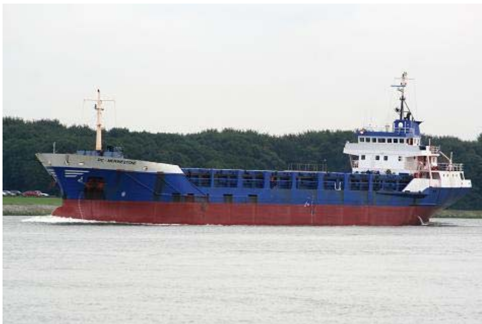
SEREEN als DC-MERWESTONE 5-10-2006

RHONEBORG 9031064, 23-7-1993 opgeleverd door Verolme Scheepswerf Heusden B.V. (1018) aan Motorschip European Express C.V., Breskens (Vroon B.V.) als EUROPEAN EXPRESS, 1994 herdoopt FRESHWATER BAY, 1996 EUROPEAN EXPRESS, 1999 ZIM AUSTRALIA, 23-11-2000 (e) herdoopt EUROPEAN EXPRESS, 11-3-2002 herdoopt MSC JAVA, 6-2-2002 verkocht aan Rederij Wagenborg B.V., Delfzijl, in beheer bij Wagenborg Shipping B.V., 19-2-2003 uit charter en herdoopt RHONEBORG, 14-8-2006 tijdens een reis van Japan naar Hong Kong, China is de machine uitgevallen.