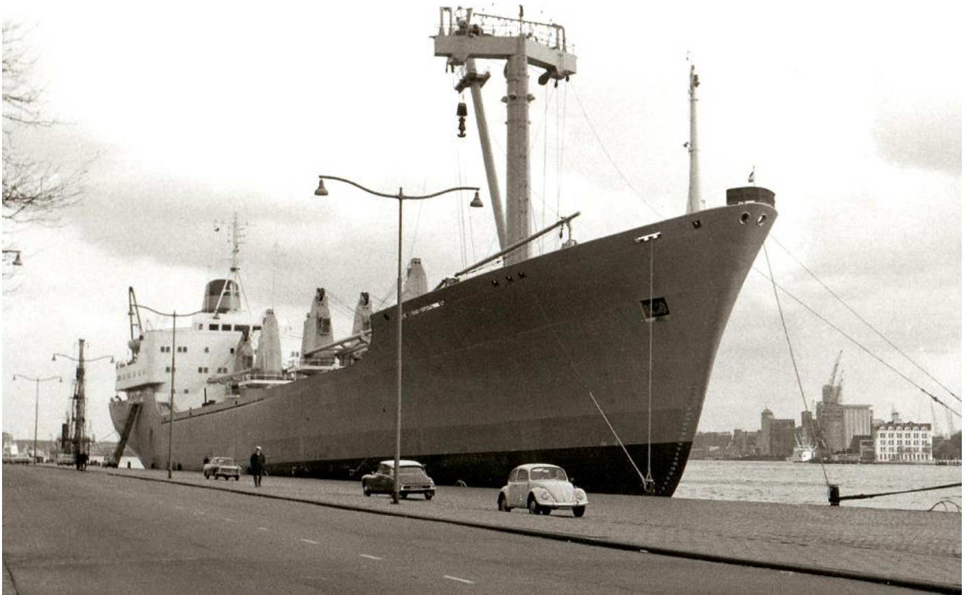
WAALEKERK, foto Wim Korndörffer†, 5-4-1968 aan de Parkkade

Vopak heeft bekendgemaakt dat zij overeenstemming heeft bereikt met Infracapital over de verkoop van haar drie chemieterminals in Rotterdam (Botlek, ex Nieuwe Matex, TTR en Chemiehaven). Deze desinvestering volgt op de strategische heroriëntatie die eerder dit jaar door Vopak was aangekondigd. De gecombineerde operationele capaciteit van de drie terminals bedraagt 1,4 miljoen cbm. Infracapital, de infrastructuurinvesteringstak van M&G Plc, is een gespecialiseerde Europese infrastructuurinvesteerder met meer dan 20 jaar ervaring op het gebied van infrastructuuractiva in Nederland. De verkoop zal naar verwachting vóór het einde van het jaar worden afgerond. (Bron en foto: Vopak/Botlek Europort, 27 September 2023).