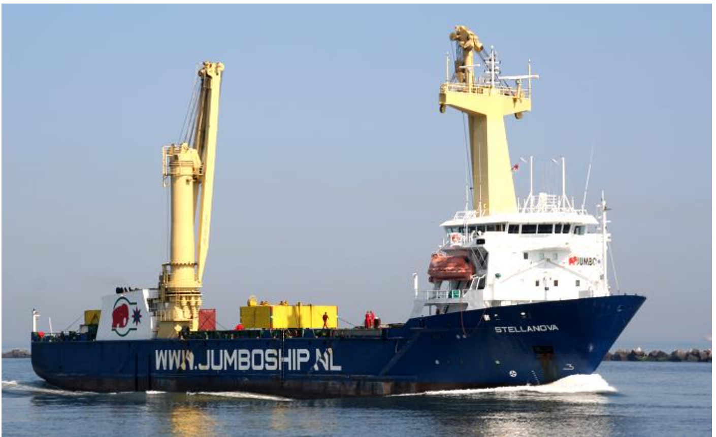
STELLANOVA, foto: Teun van der Zee, 2-7-2006

STENA FORETELLER, IMO 9214666, Ro-Ro Cargo Ship, 6-1999 contract voor Stena Ro-Ro Line Ltd., U.K., 2-2000 kiel gelegd, 14-10-2000 te water gelaten bij Dalian Shipyard (RO123-1), 25-12-2001 (e) 3-5-2002 (DNV-GL) opgeleverd als STENA FORETELLER aan Stena Line Scandinavia AB, Gothenborg-Zweden (SHQX), in beheer bij Stena AB. 24.688 GT, 7.407 NT, 11.644 DWT. 195,30 (179,51) x 26,80 x 8,70 x 7,516 meter. 24.000 kW, 4 x Wärtsilä-Sulzer 8ZAL40S, Wärtsilä Italia S.p.A. 7-2002 herdoopt CETAM MASSILIA. 11-2003 verkocht aan Stena Ro-Ro AB, Gothenborg-Zweden (SHQX), in beheer bij Northern Marine Management Ltd. en Stena AB, herdoopt STENA FORETELLER. 2-2014 in beheer bij Stena Ro-Ro AB en Stena AB. 2005 in charter Transfennica Logistics (Spliethoff-Groep). 27-4-2017 in beheer bij Northern Marine Management Ltd. en Stena AB. 2008 uit charter Transfennica. 4-3-2019 verkocht aan Stena Rederi AS, 3-2019 vlag: Denemarken (DIS) (OYYI2). 3-11-2023 van Birkenhead naar Rotterdam. 5-11-2023 gearriveerd bij Damen Verolme Dok 6 te Rozenburg om circa 3 weken te dokken, 8-11-2023 onder de Nederlandse vlag gebracht. 26-11-2023 vervangt de SOMERSET op de dienst Europoort-Harwich in beheer bij Stena Line B.V., Hoek van Holland. De SOMERSET gaat terug naar de eigenaar CLdN Ro-Ro S.A. (Cobelfret). De STENA FORETELLER is vervangen door de STENA FORWARDER (IMO 9645396) op de dienst Belfast-Liverpool (Birkenhead).