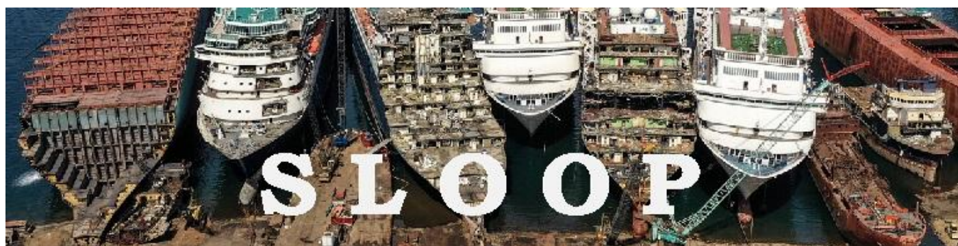
Sloopprijzen 9-2022, bron GMS Inc.

Het Russische megajacht DILBAR (Zeebrief 189 en 190), in maart 2022 aangehouden in Hamburg in verband met de sancties tegen de Russische oligarchen, is nu opgelegd in Bremen.