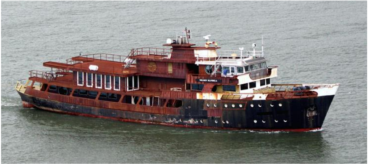
NELSON MANDELA, passage Maassluis-West op weg naar Lissabon, foto Reinier van de Wetering

GOTTHILF HAGEN, IMO 5134131 (Zeebrief #31), loodsboot. 1959 opgeleverd door Jos L. Meyer, Papenburg (496) aan Wasser- & Schifffahrtsdirektion Bremen, Bremerhaven-B.R. Duitsland (DBLR). 763 BRT, 48 passagiers. 23-12-2011 gearriveerd bij VeKa te Werkendam. 2012 verkocht aan Piet Versluis Sr., te Werkendam om verbouwd te worden tot jacht, 2012 t.b.n. NELSON MANDELA. 2022 vlag: U.K. (MMRT9). 13-9-2022 herdoopt NELSON MANDELA. (MMSI: 232045036). 27-9-2022 verhaald van Puttershoek naar 's-Gravendeel. 28-9-2022 vertrokken van 's-Gravendeel naar Lissabon. (Foto: Frits Olinga, 11-9-2007).