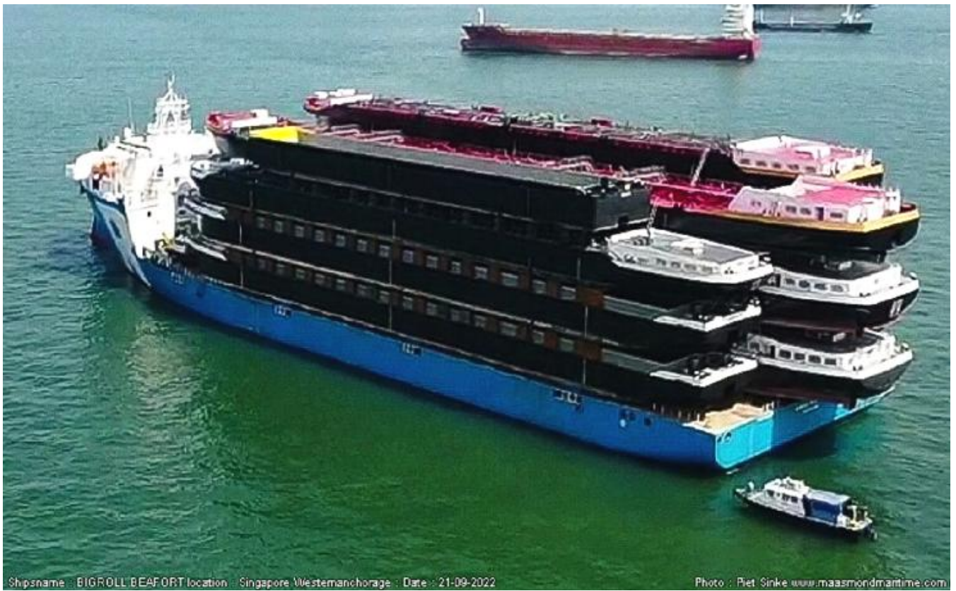
Shipsname : BIGROLL BEAUFORT location : Singapore Westemanchorage Date : 21-09-2022