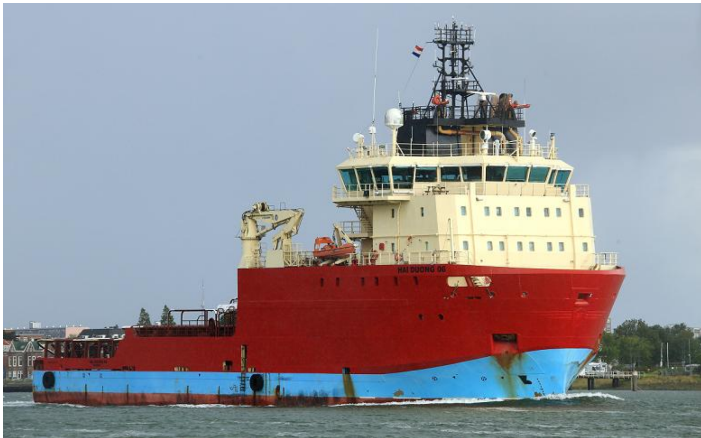
HAI DUONG 06, 17-9-2022 binnen voor de Waalhaven

MAGRITTE, IMO 7325978, Fishing Vessel, 301 GT, 807 DWT. 1974 opgeleverd als MAGRITTE. 2-2-2000 verkocht aan Grinfin S.A., Argentinië (LW3189). 2000 (e) verkocht voor sloop. 12-9-2022 aanvang sloop te Mar del Plata.