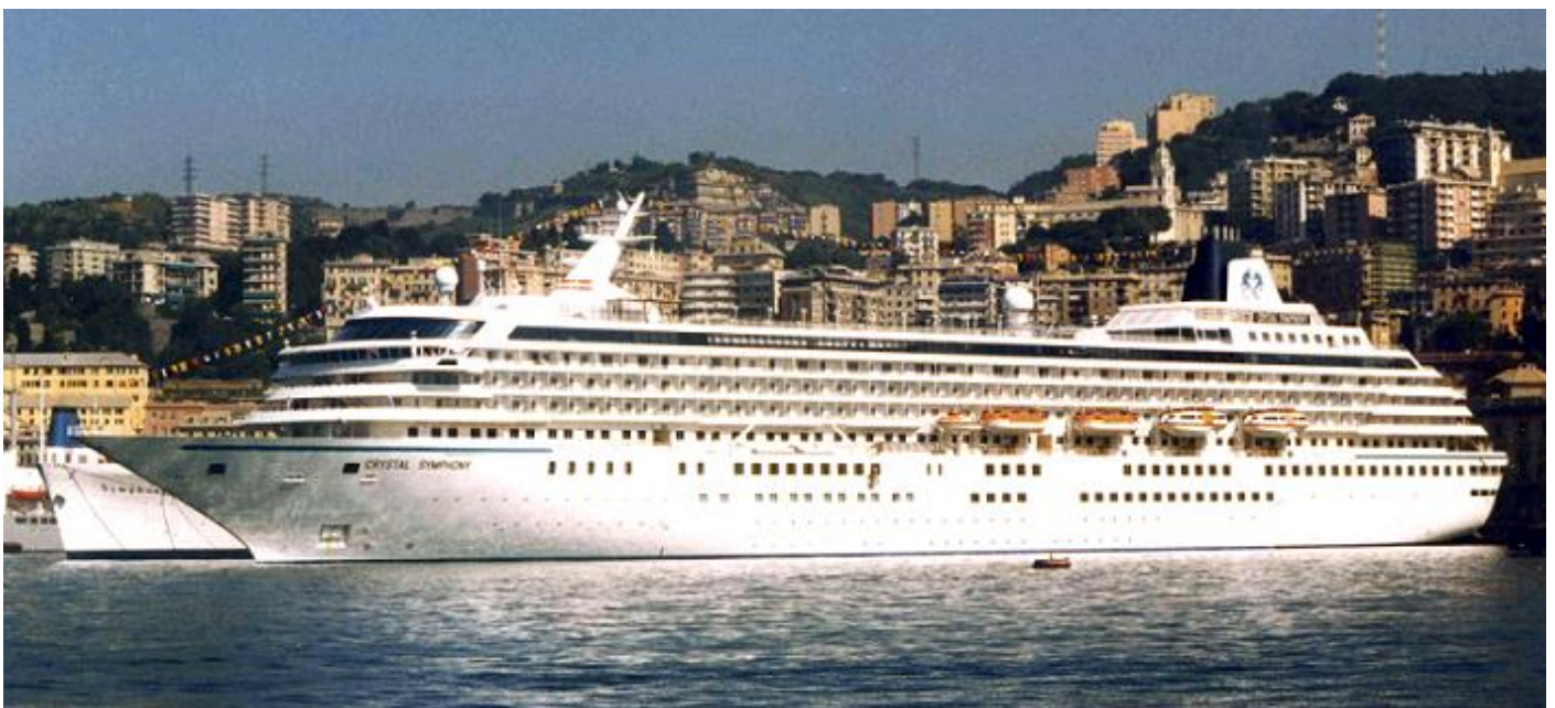
CRYSTAL SYMPHONY: 8-6-1999, Genua

Carnival Corporation meldt dat het op schema ligt met de voorgenomen vermindering van de uitstoot van broeikasgassen. De strategie is om het brandstofverbruik te verlagen en door nieuwe technologie lagere emissie te krijgen. De Carnival Corporation wil al in 2026 20% reductie bereiken, terwijl eerder dat in 2030 moest worden bereikt. De schepen zijn nu uitgerust met efficiënte AC-installaties en LED-verlichting en het op afstand monitoren van de motoren waarmee 5 tot 10% besparing is bereikt. Inmiddels is 60% van de schepen uitgerust voor walstroom. De besparing is ook bereikt door de verkoop van oudere schepen en door nieuwe schepen met een optimale rompvorm, speciale verfsoorten en "luchtsmeersystemen" die de waterweerstand verlagen waardoor tot 5% minder brandstof wordt gebruikt. Negen schepen kunnen op LNG varen en 90% van de vloot is met scrubbers uitgerust. Ook worden vaarschema's aangepast zodat de schepen langzamer kunnen varen en gebruik maken van zeestromen en weerrouting. De Corporation volgt nieuwe technologie op de voet. Het doel is om in 2050 0% uitstoot van broeikassen te bereiken.